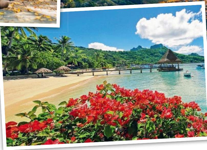
Willkommen im Paradies: Der Strand Matira ist eines der Highlights auf dem Bora-Bora-Atoll.

AIDAaura | 117 Tage | 08.10.2018 bis 02.02.2019