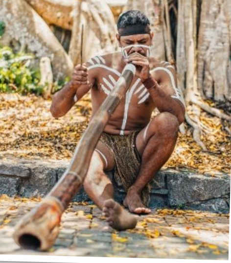
Erleben Sie die faszinierende Kultur der australischen Aborigines.