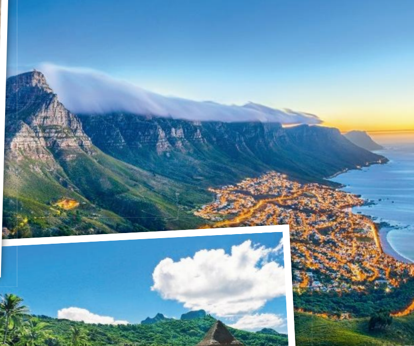
Unvergessliche Eindrücke: Der majestätische Tafelberg und die Küste Kapstadts sind wahre Traumziele in Südafrika.