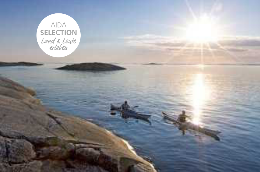
Kajakfahrer in der Schärenlandschaft, nahe Stockholm

Wandern Sie durch die idyllische Landschaft der Åland-Inseln mit ihren Wäldern, Wiesen und kleinen Dörfern oder erkunden Sie die zaubernde Inselwelt der Schären bei einer Kajaktour. Nahe Klaipėda lockt ebenfalls eine besondere Naturschönheit: Der Nationalpark Kurische Nehrung mit seinen endlosen Dünenlandschaften ist der perfekte Ort für einen erholsamen Sommertag.