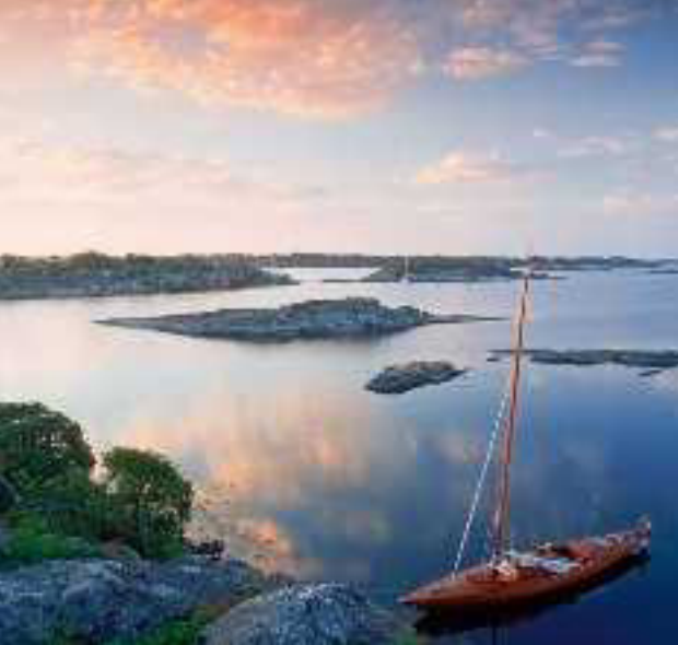
Sonnenaufgang im Schärengarten, nahe Stockholm

Im ehemaligen Zarendorf Puschkin wartet einer der schönsten Barockpaläste Europas auf Sie: der Katharinenpalast. Bereits die grandiose Fassade wird Ihnen den Atem verschlagen – aber warten Sie ab, bis Sie den Nachbau des legendären Bernsteinzimmers sehen. Er soll noch prachtvoller sein als das auf geheimnisvolle Weise verschollene Original. Prachtbauten wie das Stockholmer Schloss und die Königliche Oper können Sie ganz entspannt bei einer Bootsfahrt durch Schwedens Hauptstadt auf sich wirken lassen.