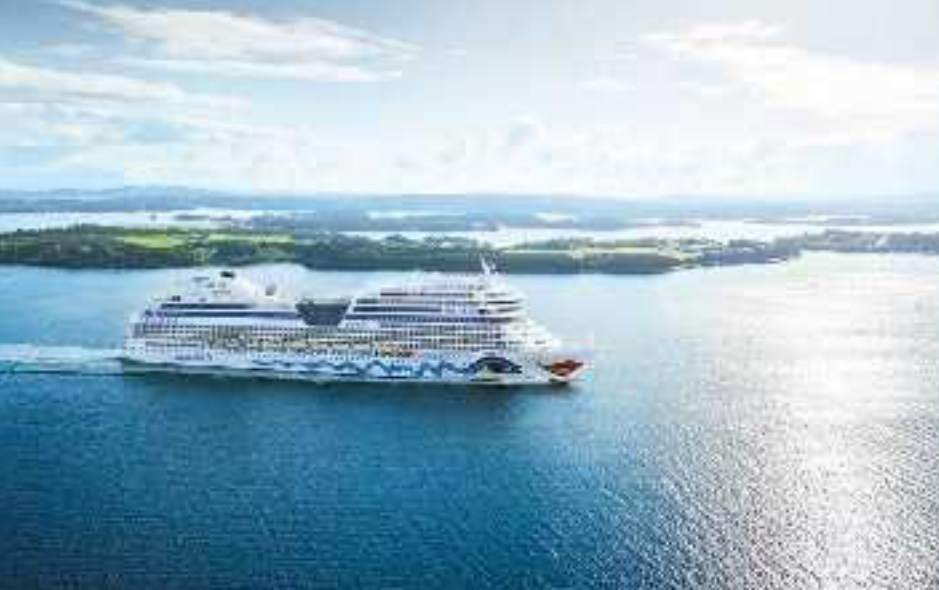
AIDamar an der Schärenküste, Schweden

Ein Besuch in Tallinns historischem Zentrum gleicht einer kleinen Zeitreise. Vom Reichtum der einstigen Hansestadt zeugen die Gildehäuser rund um den Rathausplatz, und die prachtvolle Alexander-Newski-Kathedrale ist ein Erbe aus der Zarenzeit. Auch in Stockholms Altstadt Gamla Stan bezaubern am einstigen Marktplatz Stortorgett aufwendig restaurierte Bürgerhäuser.