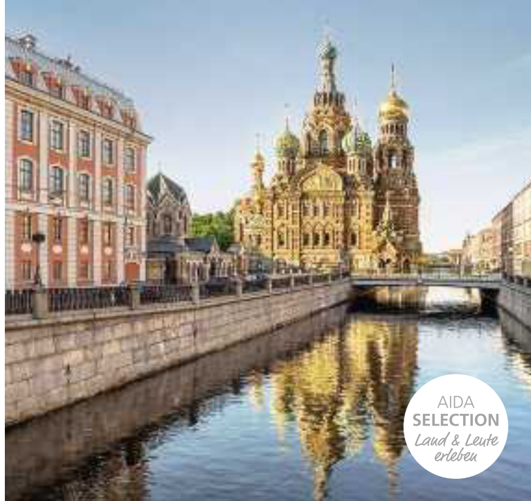
Auferstehungskirche, St. Petersburg

In den Zarenpalästen von St. Petersburg können Sie in barocker Pracht und legendären Kunstschatzen schwelgen. Als krönendes Erlebnis tauchen Sie bei einem klassischen Ballettabend in die wundervolle russische Kultur ein. Auch Riga sollten Sie mit allen Sinnen genießen. Bestaunen Sie die Kirchen und Gildehäuser, probieren Sie in der Markthalle lettische Spezialitäten wie Käse, Fisch und aromatischen Honig oder lassen Sie die malerische Natur der Lettischen Schweiz auf sich wirken.