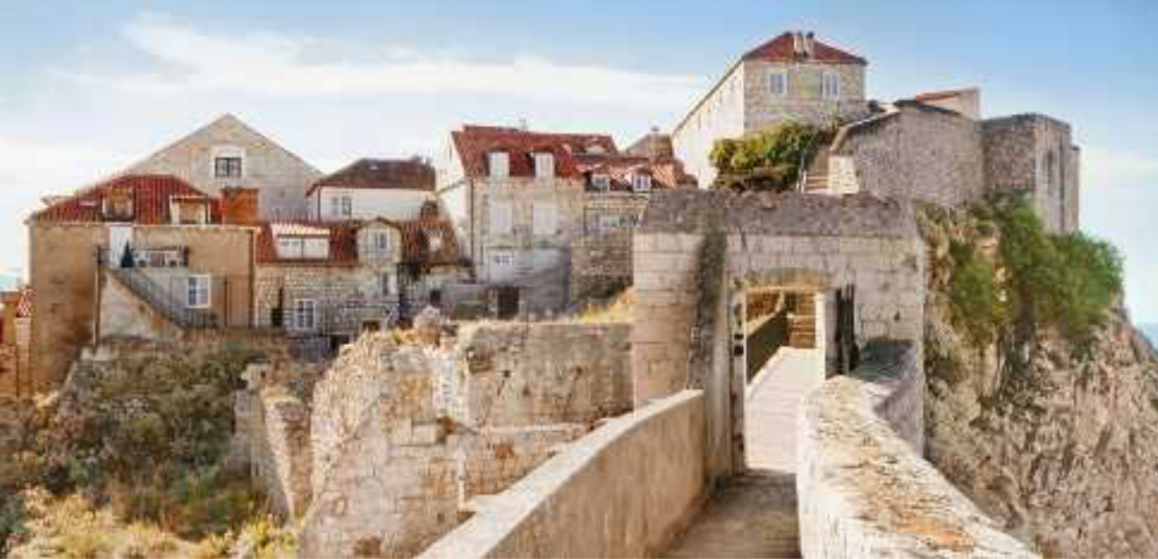
Alte Stadtmauer, Dubrovnik

Es gibt keine bessere Art, die Lagunenstadt Venedig zu erkunden, als auf dem Wasserweg. Fahren Sie ganz entspannt mit einer Gondel, einem Wassertaxi oder einem Vaporetto, dem »Bus« auf dem Canal Grande, am Markusplatz und den prunkvollen Palazzi vorbei sowie unter der Rialto-Brücke hindurch. Der Einfluss der Venezianer reichte einst bis nach Korfu-Stadt, wo Sie noch heute die italienische Architektur der alten Festung Palaió Froúrio und der Kolonaden bewundern können. Absolutes Highlight: die Sandstrände im Westen der Insel. Ein weiterer Höhepunkt ist ein Spaziergang auf der imposanten, fast zwei Kilometer langen Stadtmauer von Dubrovnik, wo Sie mit einem fantastischen Blick auf den Hafen und die Altstadt belohnt werden.