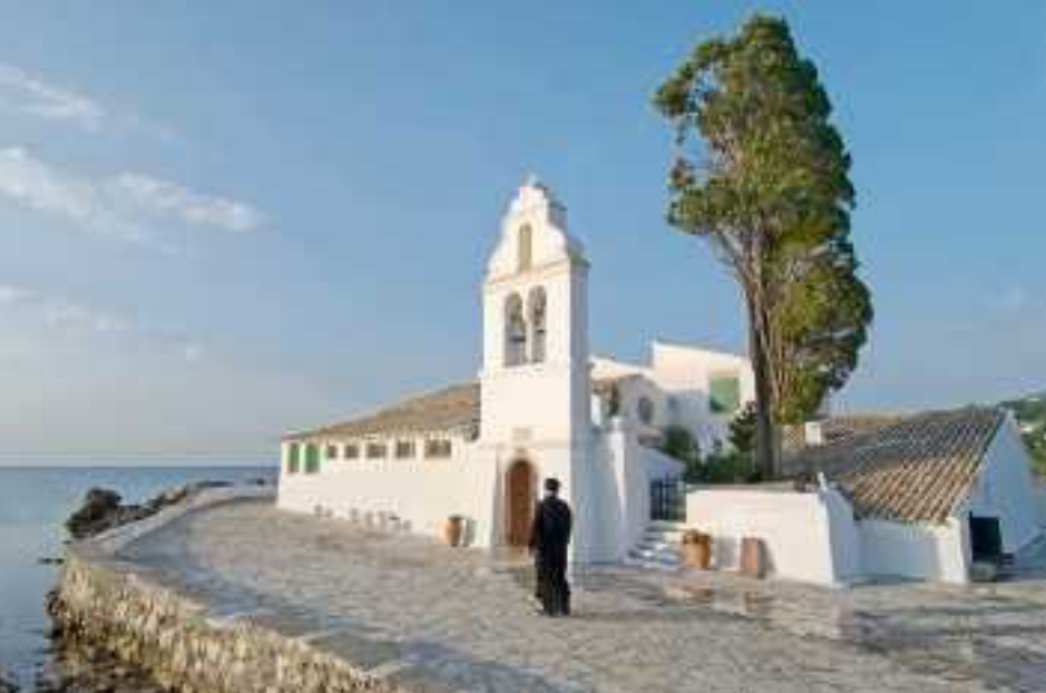
Kloster Vlacherna, Korfu

Über tausend Inseln, kleine Eilande und Felsen säumen die Adriaküste Kroatiens. Bei einer Bootsfahrt von Zadar aus können Sie die zauberhafte Inselwelt entspannt genießen. Auf Entdecker wartet die wunderschöne Altstadt von Zadar. Die zweigeschossige Rundkirche, einst als Hauskapelle für Bischof Donatus erbaut, ist das Wahrzeichen der Stadt.