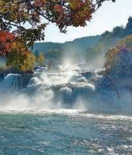
Wasserfall Skradinski buk, nahe Zadar

Von den romantischen Kanälen und belebten Plätzen Venedigs aus geht es über Korfu und Bari an die malerische Küste Montenegros. Hier liegt die Bucht von Kotor zu Füßen des »Heiligen Iwan«, wie der Berg über der Stadt genannt wird. Nicht ganz so hoch, dafür aber umso spektakulärer zeigt sich der Wasserfall Skradinski buk im Krka-Nationalpark bei Zadar.