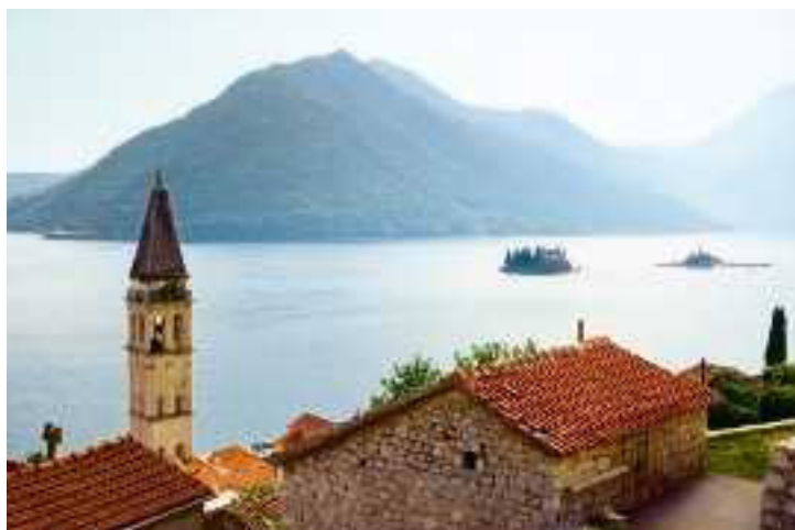
Bucht von Kotor, Perast

Von den romantischen Kanälen und belebten Plätzen Venedigs aus geht es über Korfu und Bari an die malerische Küste Montenegros. Hier liegt die Bucht von Kotor zu Füßen des »Heiligen Iwan«, wie der Berg über der Stadt genannt wird. Nicht ganz so hoch, dafür aber umso spektakulärer zeigt sich der Wasserfall Skradinski buk im Krka-Nationalpark bei Zadar.