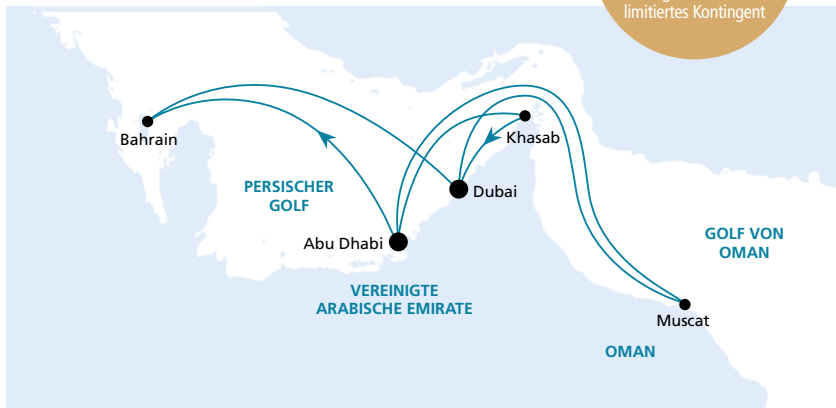
Die Karte zeigt eine optisch vereinfachte Route. Änderungen des Termins, der Route und der Liegezeiten vorbehalten.

Frühbucher-Plus-Ermäßigung: 225 €* p.P. Buchung bis 30.06.2017, limitiertes Kontingent