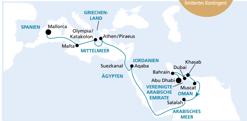
Die Karte zeigt eine optisch vereinfachte Route. Änderungen des Termins, der Route und der Liegezeiten vorbehalten.

Buchung bis 30.11.2016, limitiertes Kontingent