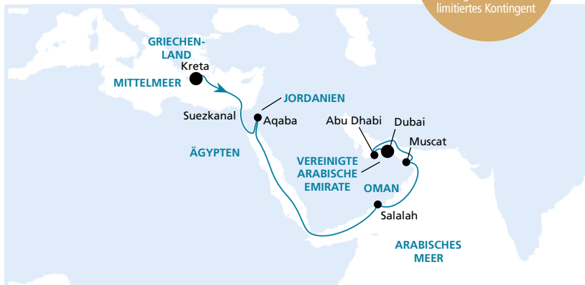
Die Karte zeigt eine optisch vereinfachte Route. Änderungen des Termins, der Route und der Liegezeiten vorbehalten.

Frühbucher- Plus-Ermäßigung: 300 €* p.P. Buchung bis 30.06.2016, limitiertes Kontingent