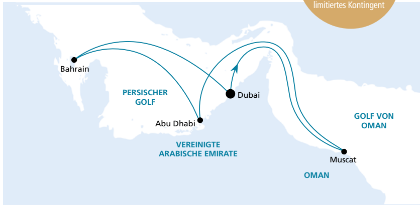
Die Karte zeigt eine optisch vereinfachte Route. Änderungen der Termine, der Route und der Liegezeiten vorbehalten.

Frühbucher-Plus-Ermäßigung: 150 €* p.P. Buchung bis 30.06.2016, limitiertes Kontingent