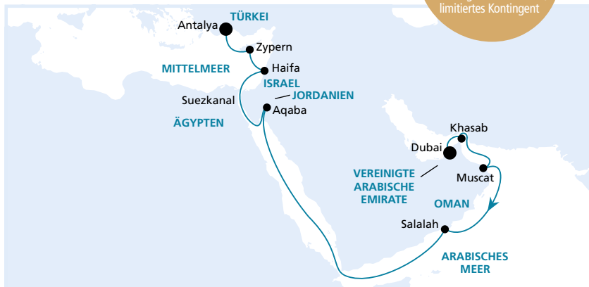
Die Karte zeigt eine optisch vereinfachte Route. Änderungen des Termins, der Route und der Liegezeiten vorbehalten.

Frühbucher- Plus-Ermäßigung: 300 €* p.P. Buchung bis 30.11.2016, limitiertes Kontingent