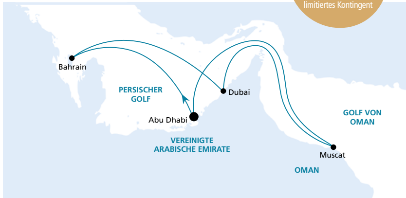
Die Karte zeigt eine optisch vereinfachte Route. Änderungen der Termine, der Route und der Liegezeiten vorbehalten.

Buchung bis 30.06.2016, limitiertes Kontingent