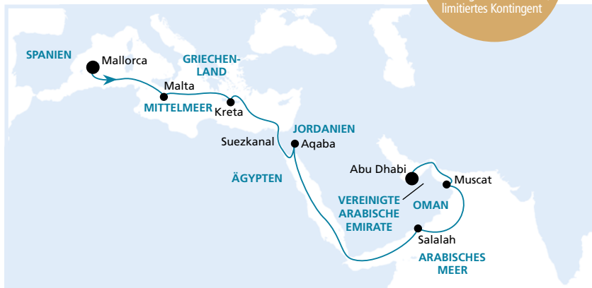
Die Karte zeigt eine optisch vereinfachte Route. Änderungen des Termins, der Route und der Liegezeiten vorbehalten.

Frühbucher- Plus-Ermäßigung: 375€* p.P. Buchung bis 30.06.2016, limitiertes Kontingent