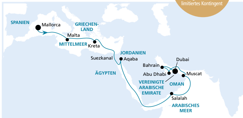
Die Karte zeigt eine optisch vereinfachte Route. Änderungen des Termins, der Route und der Liegezeiten vorbehalten.

Buchung bis 30.06.2016, limitiertes Kontingent