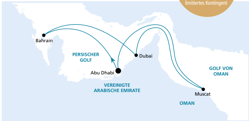
Die Karte zeigt eine optisch vereinfachte Route. Änderungen der Termine, der Route und der Liegezeiten vorbehalten.

Frühbucher-Plus-Ermäßigung: 150 €* p.P. Buchung bis 30.06.2017, limitiertes Kontingent