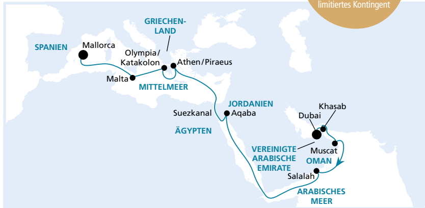
Die Karte zeigt eine optisch vereinfachte Route. Änderungen des Termins, der Route und der Liegezeiten vorbehalten.

Frühbucher- Plus-Ermäßigung: 375€* p.P. Buchung bis 30.11.2016, limitiertes Kontingent