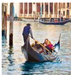
Canal Grande, Venedig

Was wäre der Besuch Venedigs ohne eine Gondelfahrt? Vom Markusplatz aus steuert Sie ein Gondolieri stillecht durch schmale Kanäle ins Herz der Stadt, die sich über die Jahrhunderte kaum verändert hat. Die wunderschönen Fassaden der alten venezianischen Palazzi zeugen vom Reichtum der Kaufleute und Adelsfamilien und bieten romantische Fotomotive ohne Ende. Auch wenn Zeit und Umwelteinflüsse ihren Tribut fordern, hat in Venedig sogar der Verfall eine gewisse Eleganz. VEN 04