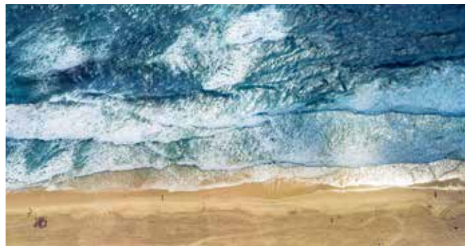
Strand vor Nin

Wahre Schmuckstücke sind die Städte Šibenik und Trogir. Im Altstadt kern von Šibenik treffen Sie auf zahlreiche Kirchen, Klöster und Paläste – das Kulturerbe einer tausendjährigen Geschichte. Eines dieser Bauwerke ist die Kathedrale des heiligen Jakob, deren Bauzeit unglückliche 100 Jahre betrug. In Trogirs mittelalterlicher Altstadt werden Sie sich wie in einem Freilichtmuseum fühlen. Ein Spaziergang durch die Gassen gleicht einer Wanderung durch die Jahrhunderte. ZDR 03