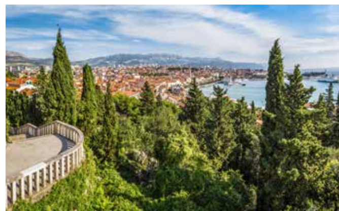
Blick auf Split, Kroatien

Split ist mit rund 180.000 Einwohnern die zweitgrößte Stadt Kroatiens nach der Hauptstadt Zagreb. Sie erstreckt sich in der Region Dalmatien auf einer Halbinsel an der kroatischen Adriaküste.