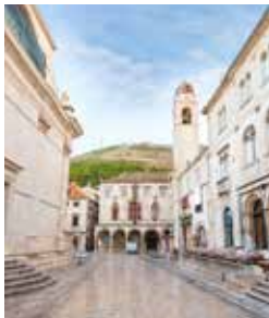
Altstadt von Dubrovnik

Das Pile-Tor bietet den besten Zugang zum Herzen Dubrovniks, denn hier beginnt die Hauptstraße Stradun, die den historischen Stadtkern durchzieht. Das mittelalterliche Franziskanerkloster gehört zu den beliebtesten Sehenswürdigkeiten. Der Rektorenpalast war einst Regierungssitz der unabhängigen Republik Dubrovnik, bis Napoleon im Jahr 1808 einmarschierte. Zum Glück zerstörte er „nur“ die Republik und ließ das Bauwerk stehen, ebenso wie den Sponzapalast und den Onofrio-Brunnen. DBV 01