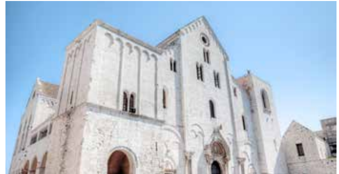
Basilika San Nicola, Bari

Das Wahrzeichen der Region, das Castel del Monte, thront eindrucksvoll auf einem Hügel in der Hochebene Murge. Mit dem eigenwilligen Schloss setzte sich der Stauferkaiser Friedrich II. ein Denkmal. Die achteckige Form mit acht ebenfalls achteckigen Türmen hat keinerlei architektonische Vorbilder und ist danach auch nie mehr angewandt worden. Auf dem Weg zu diesem Monument besuchen Sie die Ölmühle der Familie Galantino, in der Olivenöle von Weltruf hergestellt werden. BRI 01