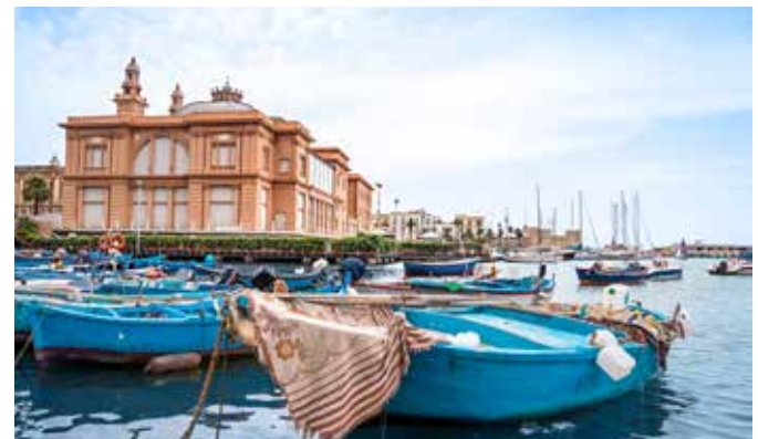
Margherita Theater, Bari