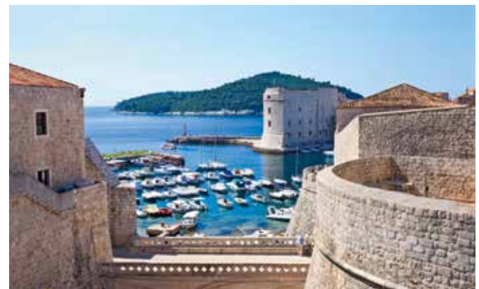
Hafen von Dubrovnik

Dubrovnik liegt am Adriatischen Meer im Süden Kroatiens. Von den ca. 4,3 Millionen Einwohnern der Republik leben ca. 43.000 in Dubrovnik.