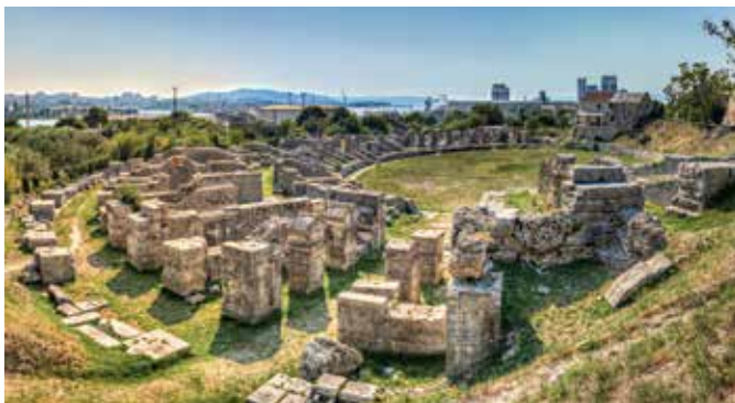
Ruinen des Amphitheaters, Salona