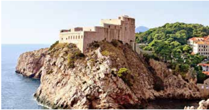
Festung Lovrijenac, Dubrovnik