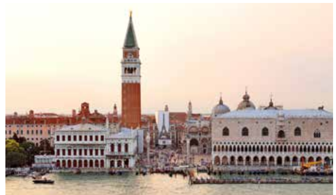
Markusplatz mit Markusturm, Venedig

Gemäßigte Klimazone mit heißen Sommern um die 27 °C und recht feuchten und kalten Wintern um 3 °C.