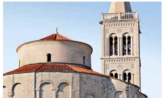
Kirche des Heiligen Donat, Zadar

Zadar liegt am Adriatischen Meer im Süden Kroatiens in der Region Dalmatien. Kroatiens Gesamtbevölkerung beträgt ca. 4,3 Millionen, davon leben ca. 75.000 Menschen in Zadar.