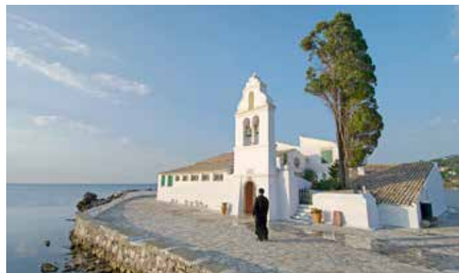
Kirche Christian Vlacherna Kanoni, Korfu