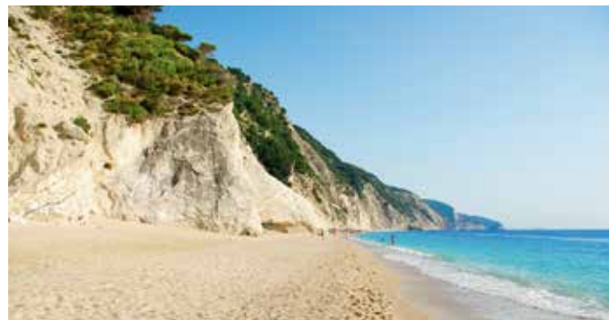
Strand auf Korfu

Diese wunderschöne Tour mit dem E-Bike führt Sie zuerst entlang der Küste Richtung Nordwesten und dann nach Pelekas an Korfus Westküste. Das Bergdorf bietet mit Kaisers Thron einen der schönsten Aussichtspunkte der Insel. Im Anschluss können Sie sich in der Bucht von Gouvia nahe Pontikonissi – der Mäuseinsel – etwas im Meer erfrischen. Eine Rundfahrt durch Korfu-Stadt vorbei an den bekanntesten Sehenswürdigkeiten sorgt für einen schönen Ausklang Ihrer Tour. CFU B04