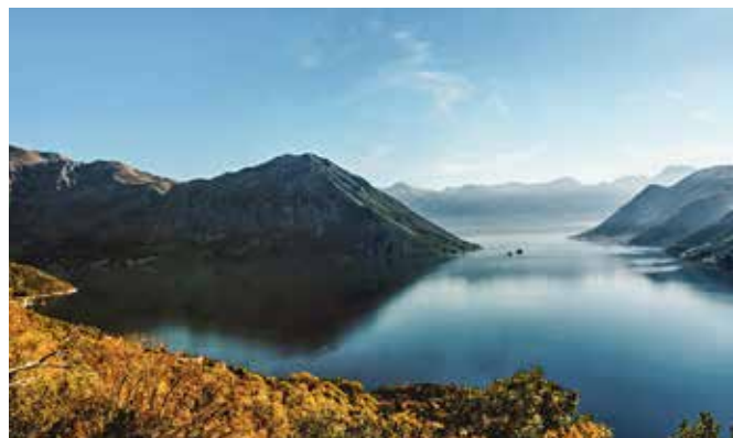
Bucht von Kotor, Montenegro