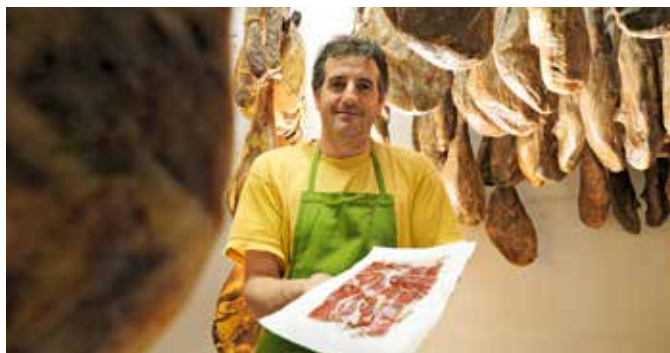
Eine lokale Spezialität: Schinken