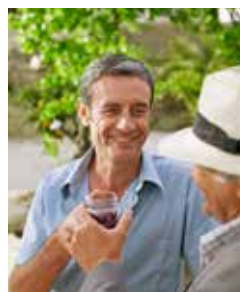
Erleben Sie eine Weinprobe

Mitten im Podelta liegt mit der ehemaligen Lagunenstadt Comacchio ein „kleines Venedig“. Sie wurde einst auf 13 Lagunen gegründet und erst im 19. und 20. Jahrhundert schrittweise trockengelegt. Den schönsten Blick auf die schmucke Altstadt haben Sie von der Trepponti-Brücke. Daneben glänzt die Stadt noch mit dem prächtigen Palazzo Bellini. Beim Rückweg ist ein Abstecher zu einem Weingut Pflicht. Schließlich werden hier einige der besten Weine der Region produziert. RAV 03