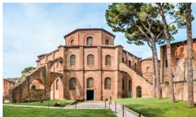
Kirche San Vitale, Ravenna