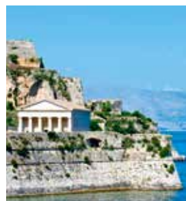
Kirche St. George, Korfu

Am Aussichtspunkt Bella Vista ist der Name Programm: Sie genießen einen atemberaubenden Blick über die gesamte Westküste. Die Bewohner des Dörfchens Makrades haben sich auf die Produktion und den Verkauf von Kräutern, Olivenöl und Kumquats (Zwergorangen) spezialisiert. Der aromatische Kumquatlikör ist eine echte Köstlichkeit, die Sie probieren müssen. In Korfu-Stadt ist die schicke Kirche Agios Spiridon, die dem Inselheiligen Spiridon geweiht ist, ein absolutes Muss. CFU 04