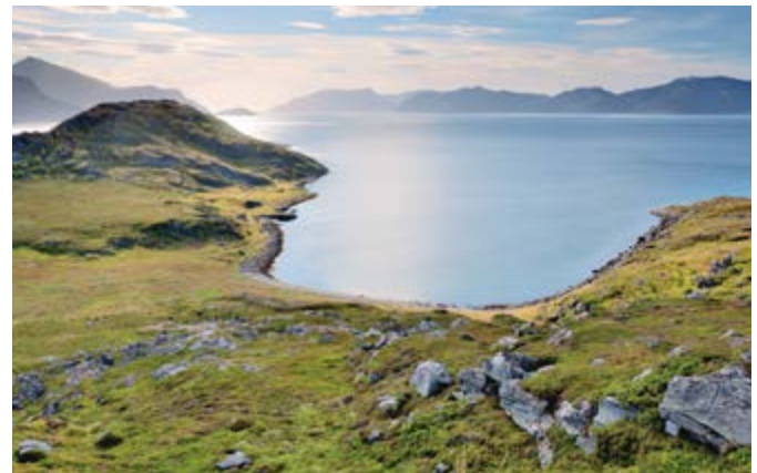
Inseln im Oslofjord