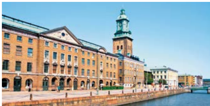
Kristinenkirche an der Hamngatan am Hafencanal