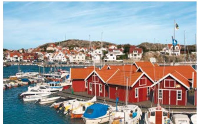
Hafen von Göteborg

Atlantische Einflüsse und das kontinentale Klima Eurasiens verursachen viel Niederschlag entlang der Küste. Die Temperaturen liegen im Mai bei durchschnittlich 16 °C, von Juni bis August bei 19–21 °C.