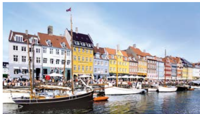
Nyhavn, Hafen von Kopenhagen

Durch die grüne Idylle des Churchill-Parks vorbei an der Kleinen Meerjungfrau gelangen Sie zum Schloss Amalienborg. Nach der Besichtigung des wundervollen Schlosshofs gehen Sie durch das Hafenviertel Nyhavn, wo einst Hans Christian Andersen lebte, zum Gammel Strand und fahren von dort mit dem Boot durch die Kanäle von Christianshavn. Attraktion in diesem Stadtteil ist die Freistadt Christiania. Die Bewohner dieser Kommune haben sogar eine eigene Währung und eine eigene Flagge. KOP 01