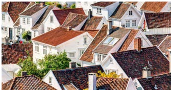
Stavanger von oben