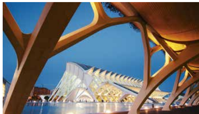
City of Arts and Science, Valencia

Bei einer großen Stadtrundfahrt mit dem E-Bike kommen Sie am größten Aquarium Europas – dem Oceanogràfic – sowie dem Opern- und Kulturhaus Palacio de las Artes Reina Sofía vorbei. Durch das ehemalige Flussbett des Turia fahren Sie weiter bis zum Botanischen Garten und von dort in die historische Altstadt Valencias. Hier ist genug Zeit für Stopps an der Plaza de la Virgen, der gotischen Kathedrale, dem Mercado Central sowie dem Rathaus – und vielleicht auch noch für den Strand. VLC B04