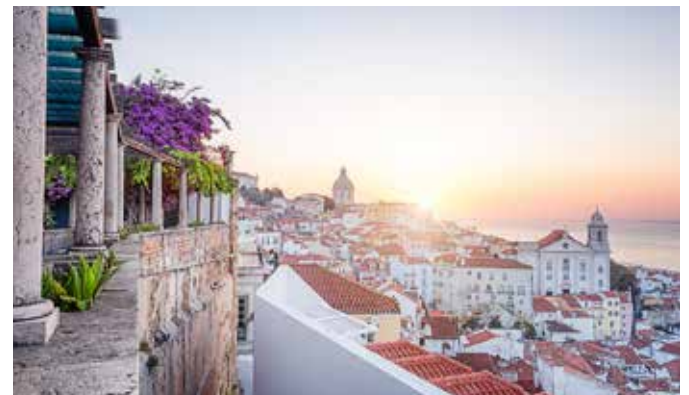
Stadtteil Alfama, Lissabon