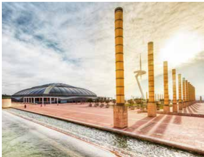
Stadion Camp Nou, Barcelona