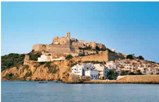
Festung Staré Město, Ibiza-Stadt