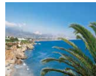
Strand von Málaga