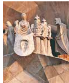
Sagrada Família, Barcelona

Die Sagrada Família ist eines der berühmtesten Wahrzeichen von Barcelona und das unvollendete Meisterwerk Gaudís. In sein letztes Werk steckte er all seine kreative Energie. Nehmen Sie sich Zeit, die Rosenkranzkapelle, die Krypta, die Apsis und den Kreuzgang zu entdecken. Nach der Besichtigung können Sie noch über die Flaniermeile Las Ramblas schlendern. Auf dem Weg zwischen der Plaça de Catalunya und dem Hafen spüren Sie die Atmosphäre und die Geschichte und Zukunft Barcelonas. BCL 17