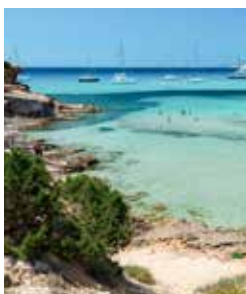
Strand auf Formentera

Nur eine kurze Fahrt mit der Fähre entfernt liegt die kleine Schwesterinsel Ibizas: Formentera. Hier empfängt Sie beinahe karibisches Flair. Türkisfarbenes Wasser, helle Sandstrände und eine ansteckende Leichtigkeit sorgen bis heute für Hippie-Feeling. In der Inselhauptstadt Sant Francesc lädt der maleische Marktplatz zu einem entspannten Bummel ein. Die Aussichtspunkte San Fernando des Roques und El Mirador de la Mola bieten einen fantastischen Blick auf die Umgebung. IBZ 15