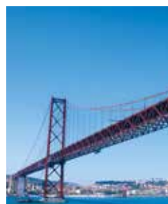
Ponte 25 de Abril, Lissabon

Futuristische Stadtrundfahrt auf trendigen Scootern: Erkunden Sie die schönsten Sehenswürdigkeiten Lissabons mit dem Segway. Zuerst fahren Sie durch den Triumphbogen zum Praça do Comércio und dann geht es mitten hinein ins Baixa-Viertel mit den Sehenswürdigkeiten der Unterstadt wie dem Elevador de Santa Justa und Praça da Figueira. Es folgt eine Fahrt zum Turm von Belém sowie zum Entdeckerdenkmal, bevor es über die monumentale Hängebrücke Ponte 25 de Abril zurückgeht. LIS S02