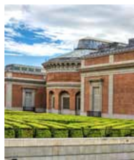
Museo del Prado, Madrid

Wer in weltberühmten Kunstwerken schwelgen möchte, ist mit dem Hochgeschwindigkeitszug in weniger als zwei Stunden in Spaniens Hauptstadt. Schon die Fahrt mit bis zu 300 Stundenkilometern ist ein Highlight. In Madrid angekommen, wird Ihr Staunen garantiert noch größer. Die rund 3.000 Gemälde umfassende Sammlung des Museo del Prado zählt zu den bedeutendsten der Welt und vereint neben spanischen und holländischen Meistern auch Werke von Botticelli, Caravaggio und Rembrandt. VLC 10