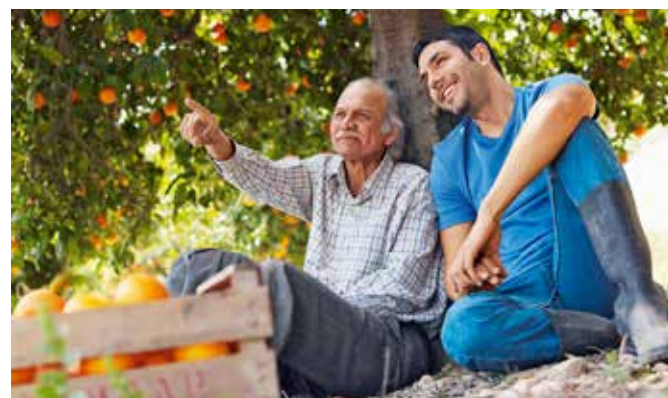
Spanisches Lebensgefühl, Orangenplantage