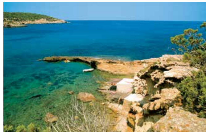
Strand auf Ibiza

Die Balearen haben das beste Klima Spaniens mit ausgeglichenen Temperaturen, die im Sommer selten über 30 °C steigen. Die Wintermonate sind mit durchschnittlich 15 °C eher frühlingshaft. Die Luftfeuchtigkeit liegt im Jahresmittel bei ca. 70 %.