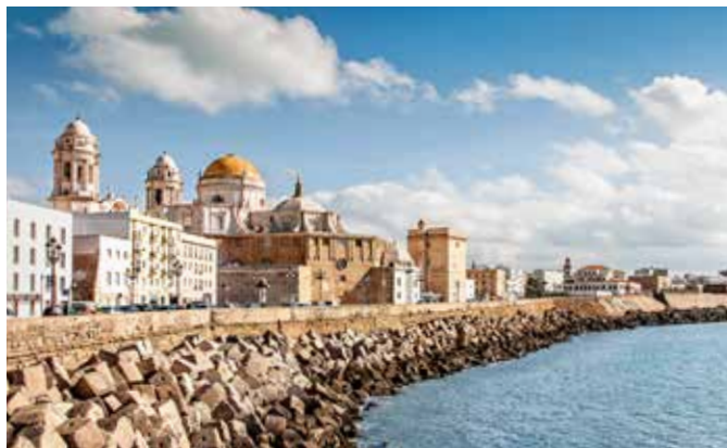
Altstadt von Cádiz