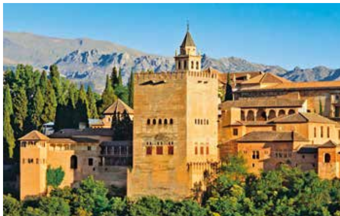
Palastanlage Alhambra, Granada