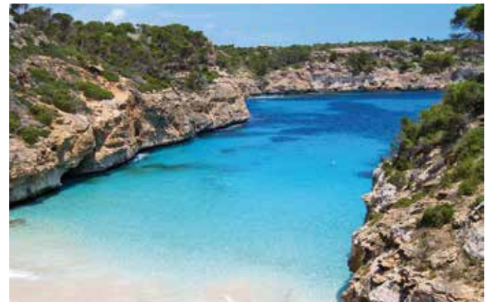
Cala d'es Moro, Mallorca

Die spanische Insel Mallorca gehört zu den Balearen. Sie liegt im westlichen Mittelmeer und hat ca. 870.000 Einwohner. Davon leben ca. 400.000 in der Hauptstadt Palma de Mallorca.