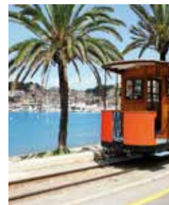
Straßenbahn in Port de Sóller

Sóller, an einer kreisrunden Bucht gelegen, ist der einzige Hafen an der Nordwestküste. Mit seinen Orangen-, Zitronen- und Olivenhainen gilt es als Obstgarten der Insel. Den „Roten Blitz“, eine gemütliche Schmalspurbahn, die Sóller und Palma über Viadukte und 13 Tunnel miteinander verbindet, lieben nicht nur Nostalgiker. Eine lange Tradition hat auch die Finca Can Det – eines der wenigen Landgüter, auf dem ökologischer Anbau betrieben wird und Olivenöl in seiner reinsten Form gepresst wird. PMI 02