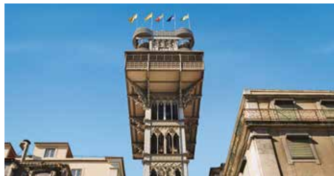
Elevador de Santa Justa, Lissabon

Die Burg São Jorge ist das älteste Bauwerk der Stadt. Von den Wehrtürmen haben Sie einen prächtigen Rundblick über die Innenstadt. Lissabons Wahrzeichen, der Turm von Belém, wacht über dem malerischen Altstadtviertel Alfama mit seinen charmant verwinkelten Gassen. Er ist ein Meisterwerk der Manuelinik – eines Baustils, wie er nur in Portugal zu finden ist. Die Charakteristika dieses Architekturstils werden Ihnen auch bei Ihrem Besuch des Hieronymusklosters vor Augen geführt. LIS 01